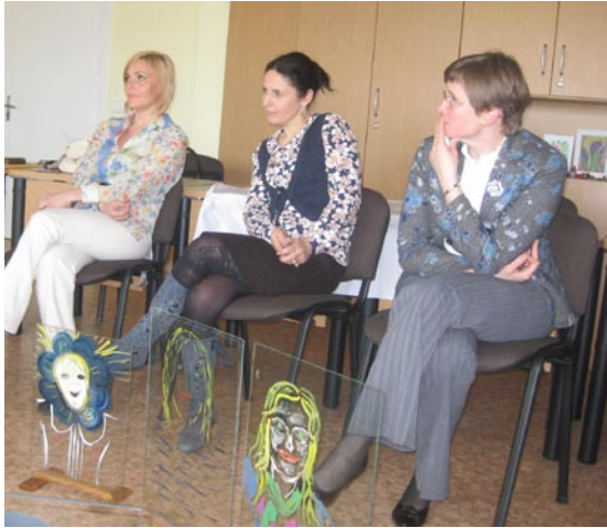
Akimirkos iš seminaro.